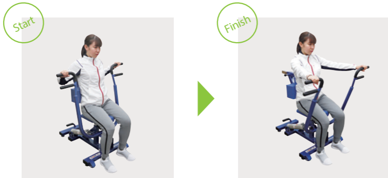
BM950000 スキャプラ・プッシュ&プル チェストプレス/ロウ