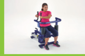
180°回旋するマシン軌道。